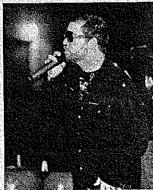
EL GRUPO interpretó varios de sus éxitos junto a los estudiantes del proyecto.

Para conocer más sobre el programa visite www.revivelamusica.org